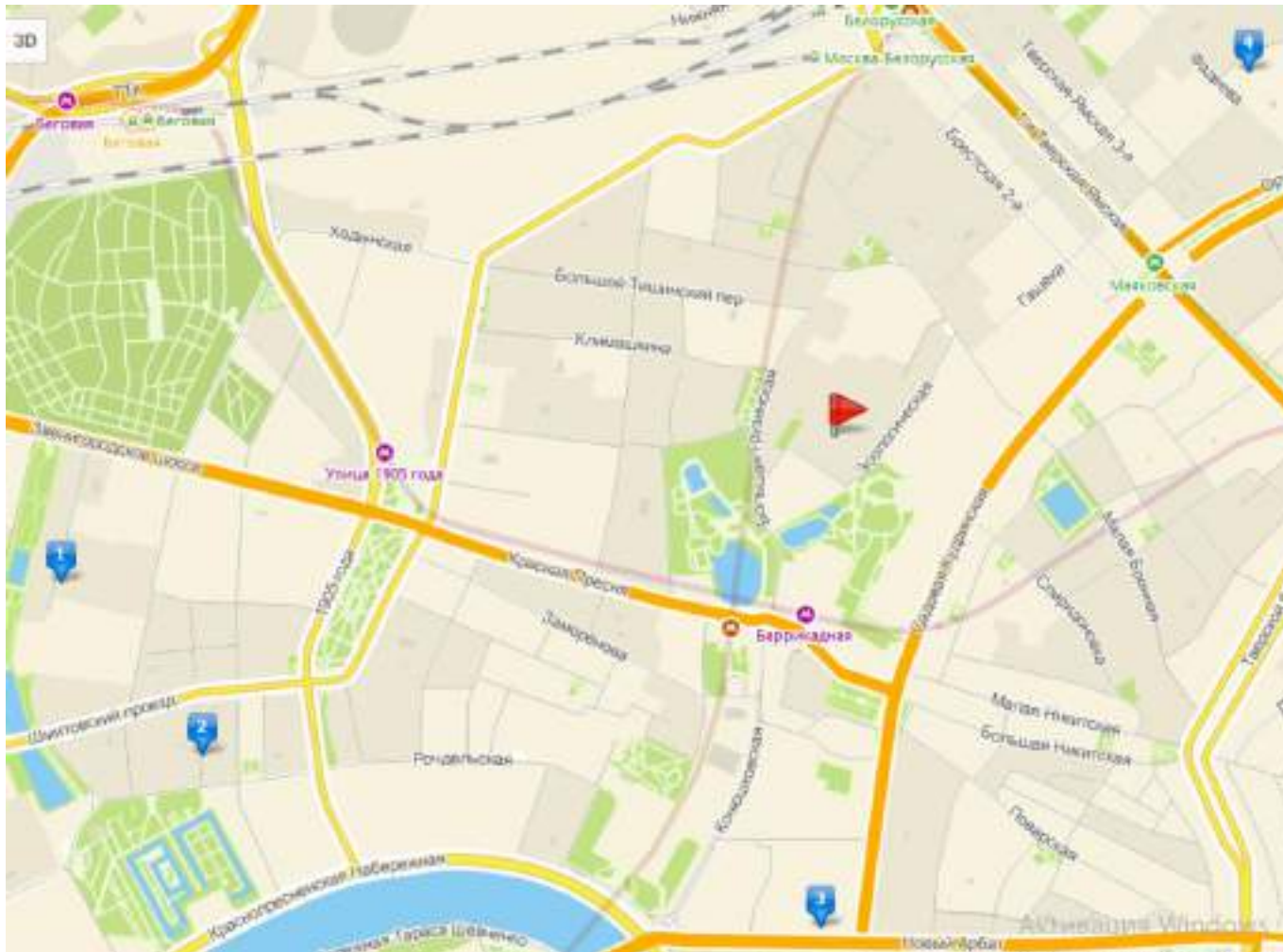
Рисунок 13. Расположение объекта оценки и объектов аналогов на карте

Поправка применена в соответствии с разделом 9.5 настоящего отчета.