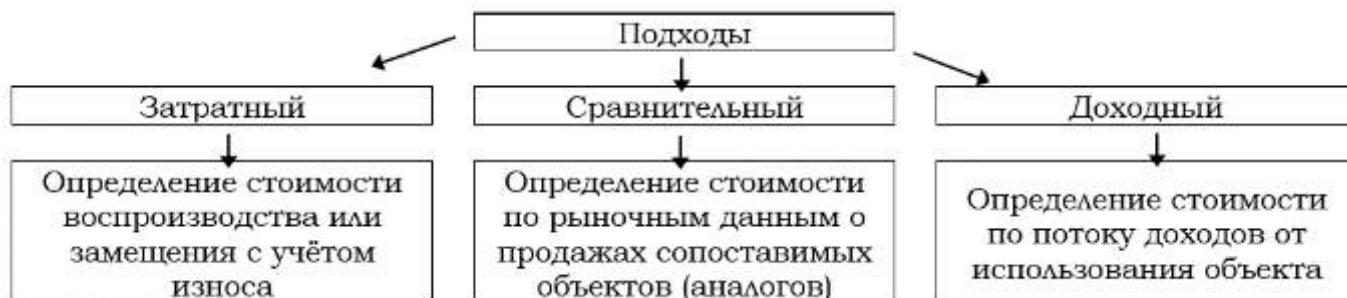
Рисунок 12. Методическая структура определения рыночной стоимости

Определение рыночной стоимости осуществляется с учетом всех факторов, существенно влияющих, как на рынок оцениваемых видов имущества в целом, так и непосредственно на ценность рассматриваемой собственности. При этом рассматриваются возможные способы использования имущества и выбирается такое, которое дает максимальный доход. Для этого проводится анализ лучшего и наиболее эффективного использования. При оценке применяются общие для всех видов имущества подходы: затратный, сравнительный, доходный (Рисунок 12).