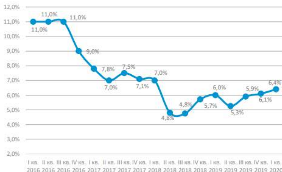
ГРАФИК 1: Динамика среднего уровня вакантности центральных улиц Москвы, %

Возросшая доля свободных помещений в I квартале 2020 г. была зафиксирована на пешеходных улицах (3,9% против 3,1% в IV квартале 2019 г.), на центральных торговых коридорах (7,4% против 6,9% в IV квартале 2019 г.) и на Патриарших прудах (6,1% против 4,4 в IV квартале 2019 г.).