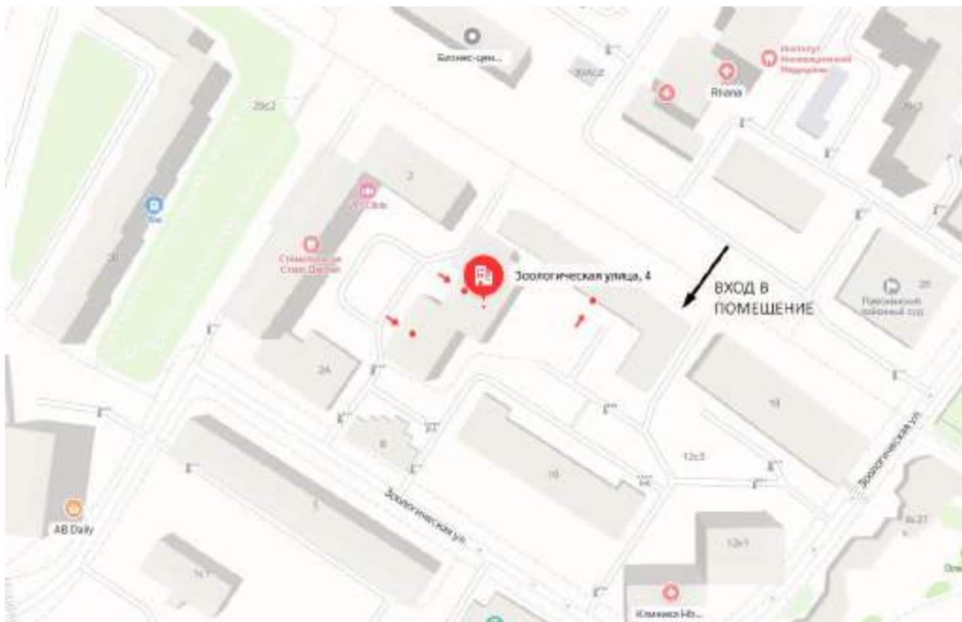
Рисунок 2. Карта локального расположения объекта оценки