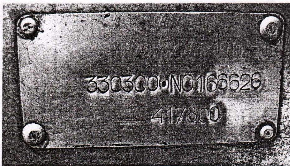
Фото 3. Место крепления заводской таблички.