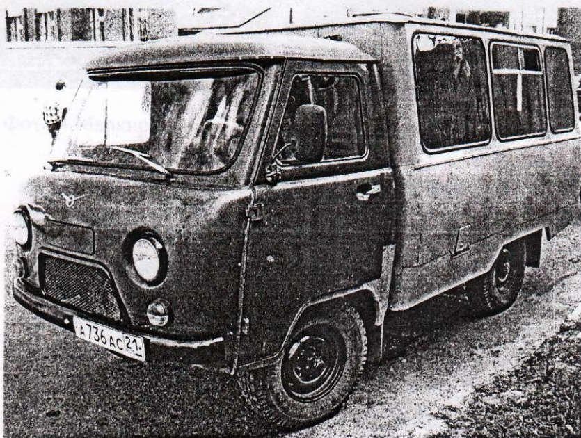
Фото 1. Внешний вид исследуемого автомобиля.

к акту экспертизы №5881 от 10 июня 2005г.