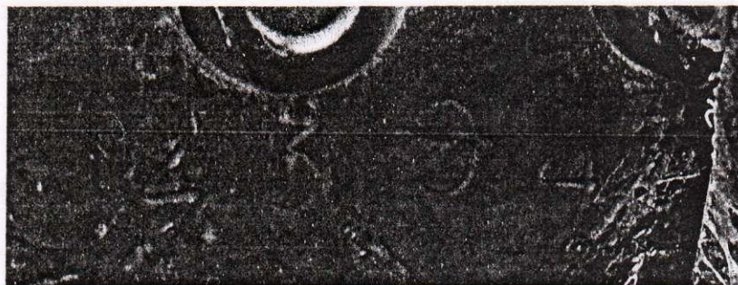
Фото 2. Маркировка кабины а/м.