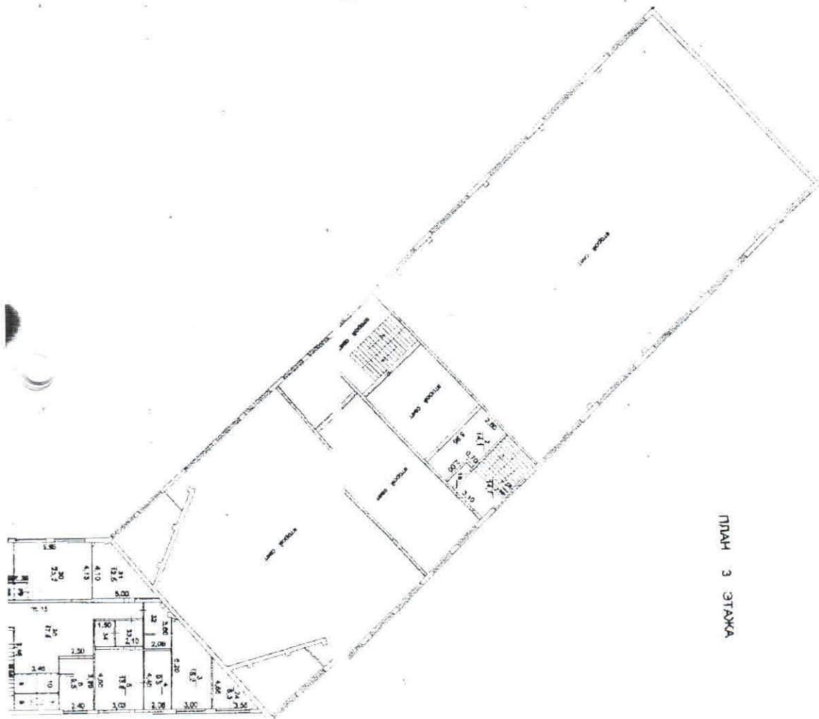
ПЛАН 3 ЭТАЖА

ПОСТАВКА ПЛАН ИНВЕНТОРИЗ. НОМЕР 400-24 строения А в размещении № 51 по ул. Кадета Курска в городе Курск Центрального округа Суровского района