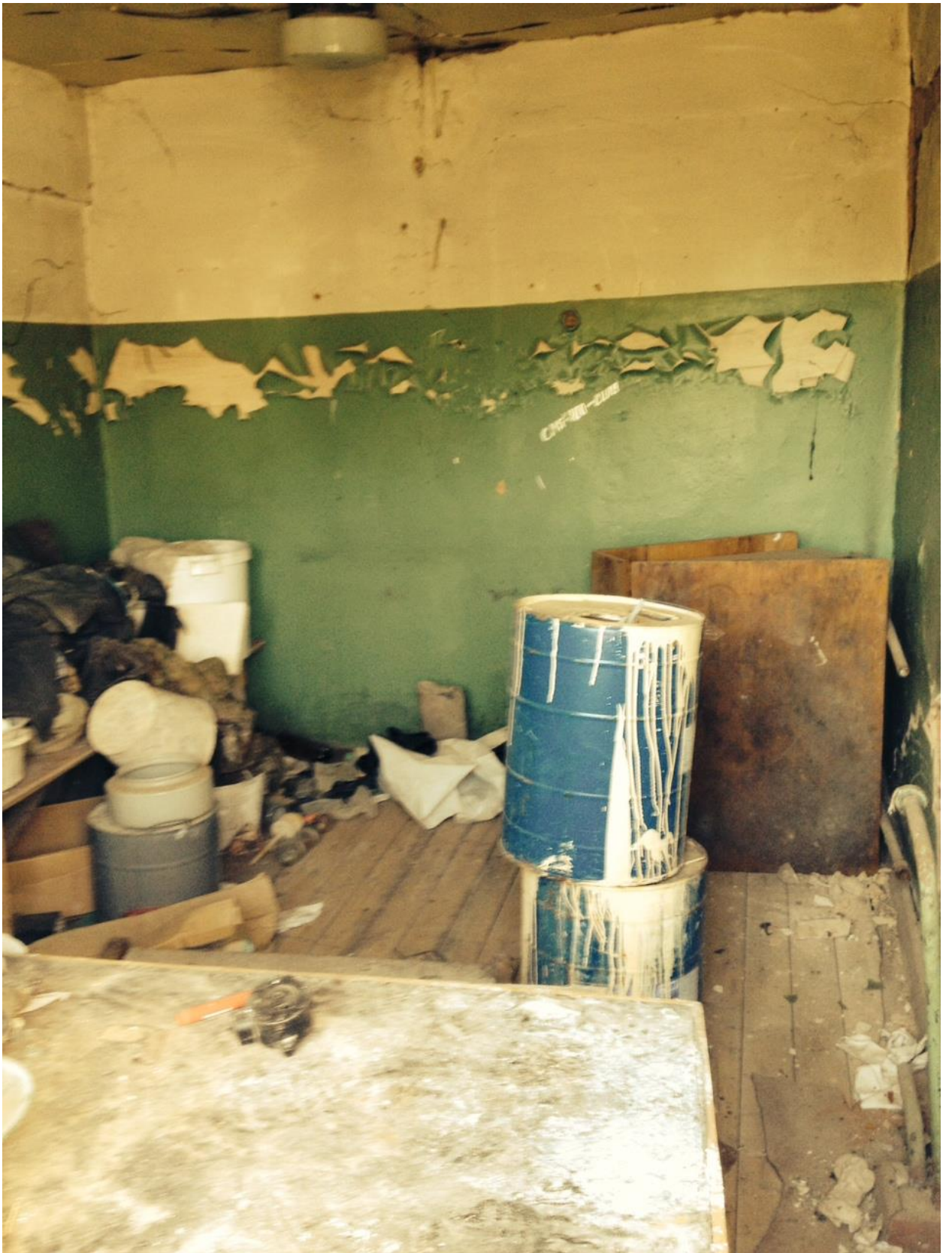
Зание цеха кузнечно-прессового