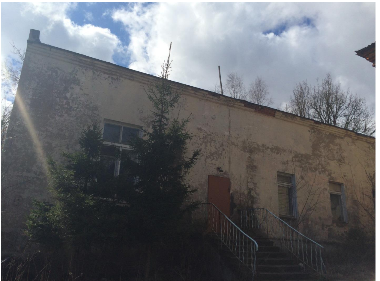
Здание кладовой 85,3кв.м.