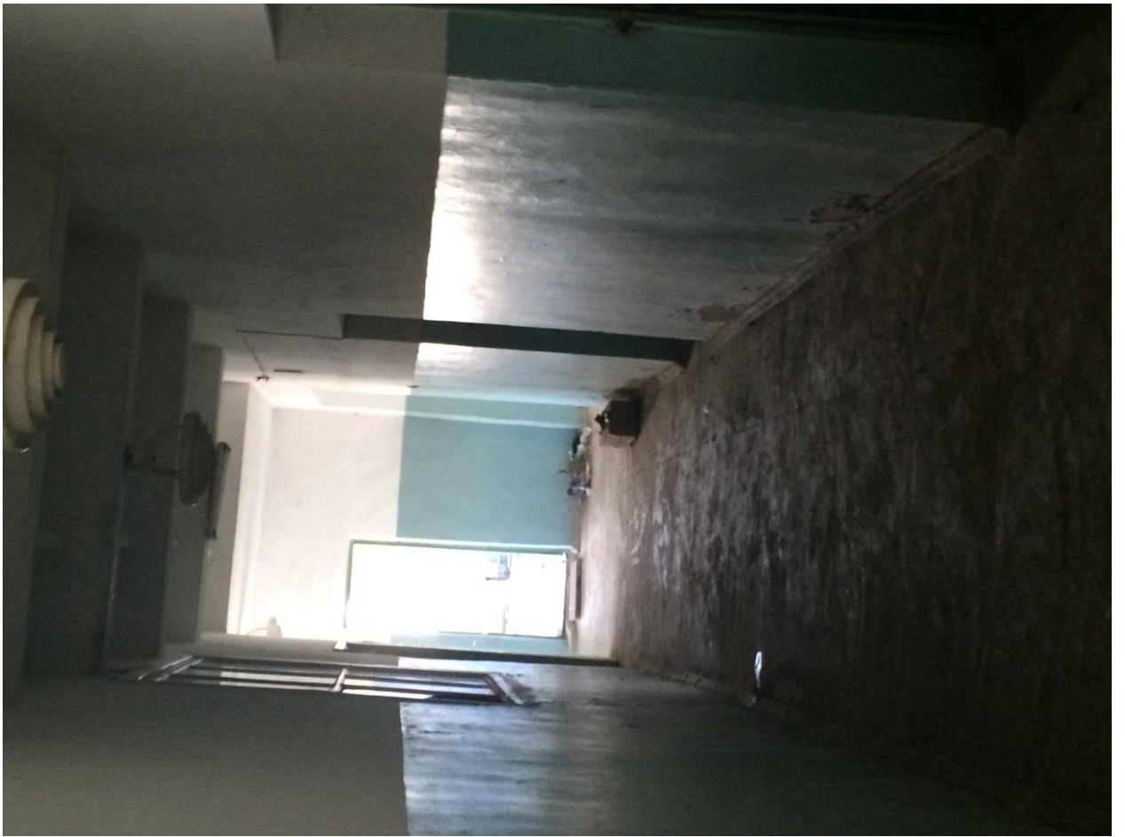
Здание красного уголка