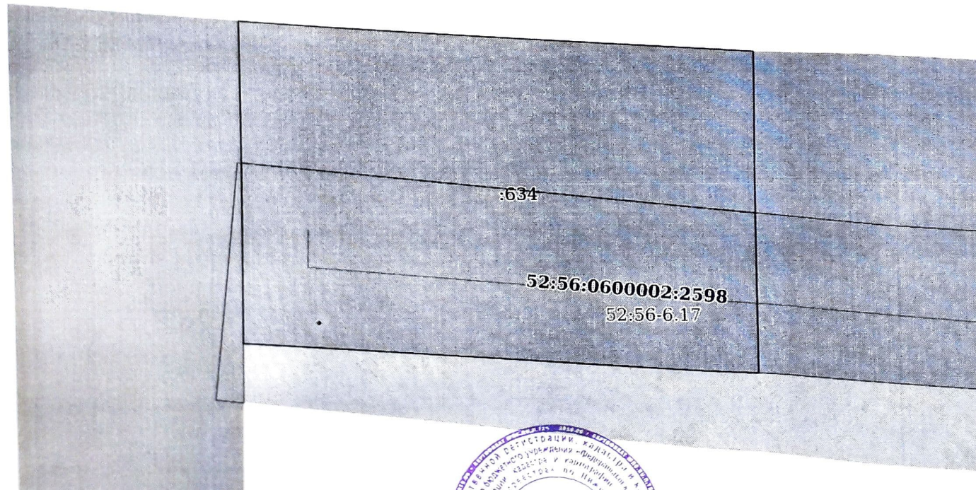
План (чертеж, схема) земельного участка