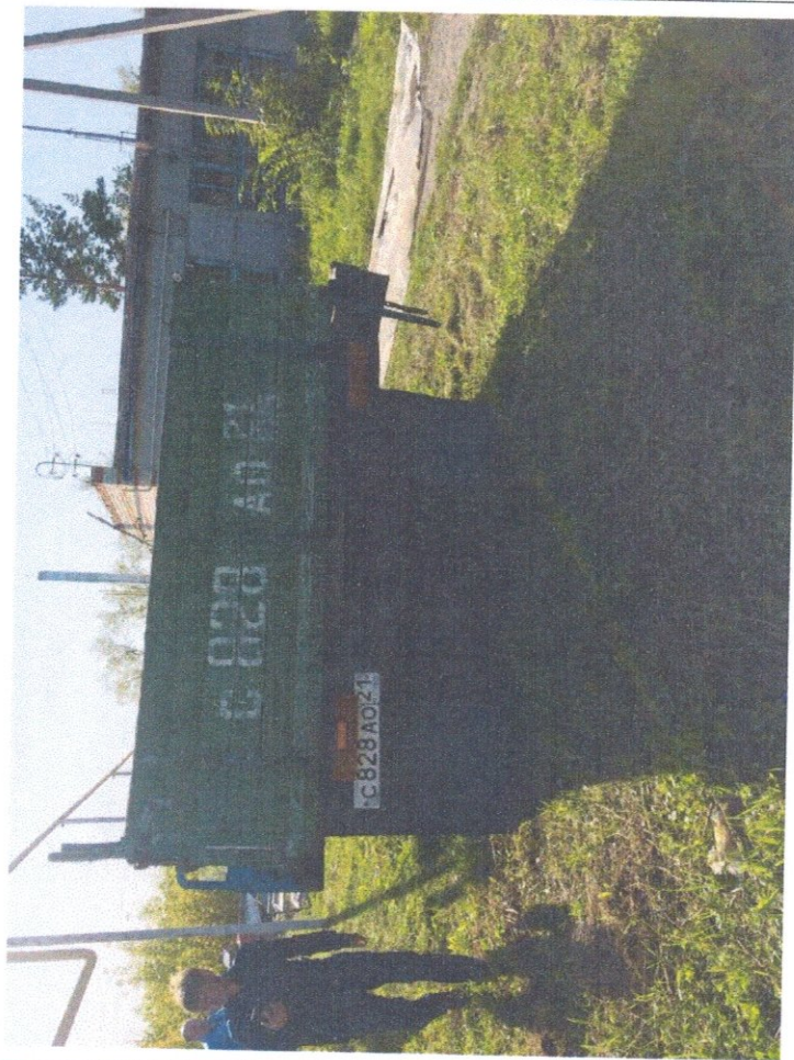
Фото 7: Состояние салона