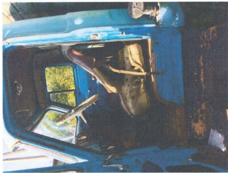
Фото 5: Общий вид