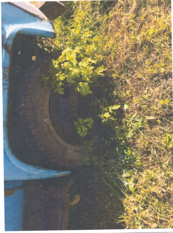
Фото 4: Общий вид