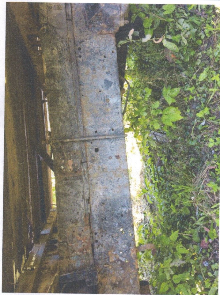
Фото 10: Общий вид