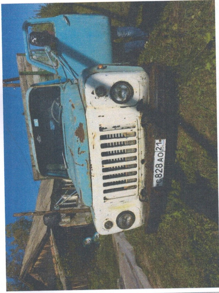
Фото 2: Общий вид