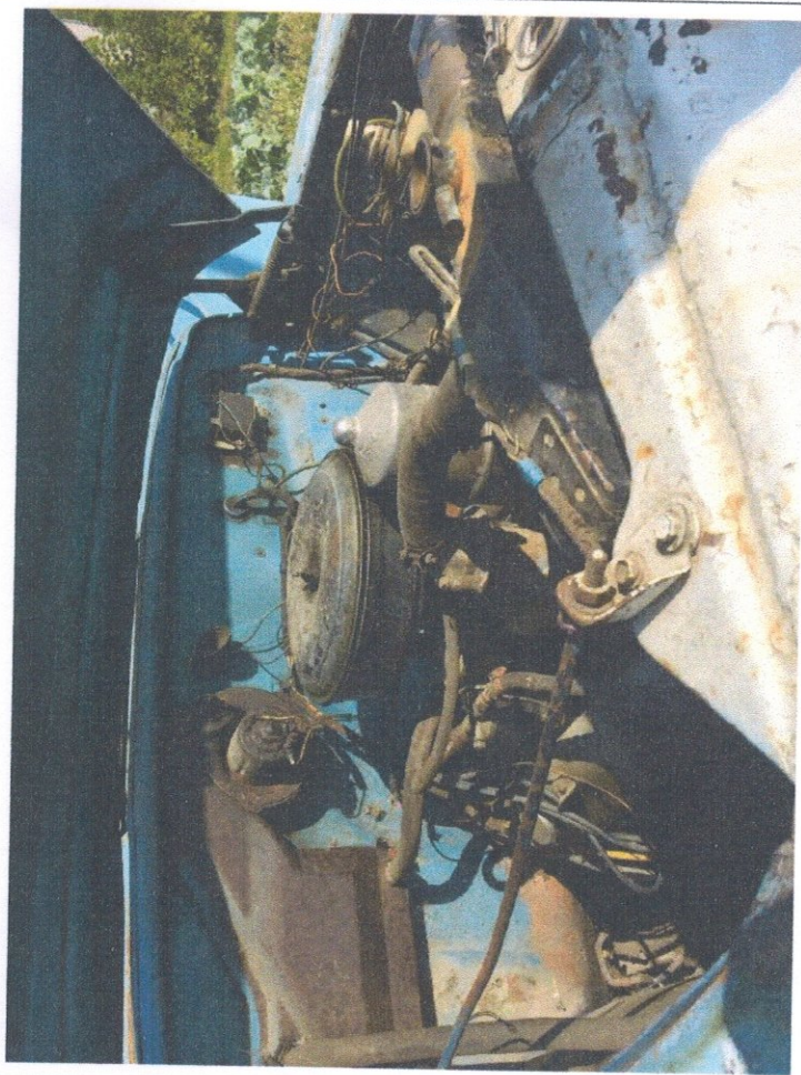
Фото 8: Приборная панель