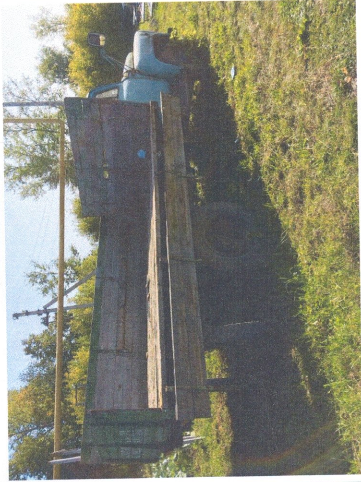
Фото 3: Общий вид