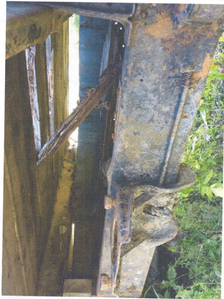
Фото 9: Приборная панель