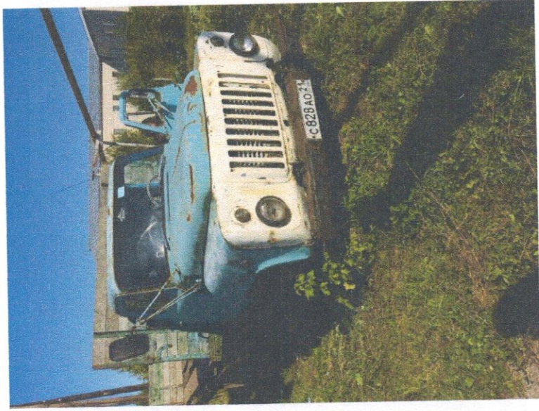
Фото 1: Общий вид