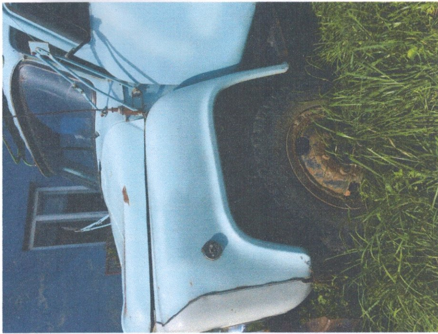
Фото 2: Общий вид