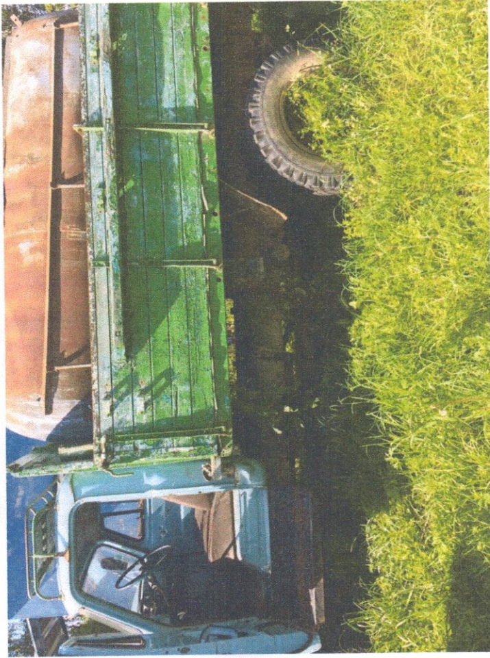
Фото 5: Общий вид