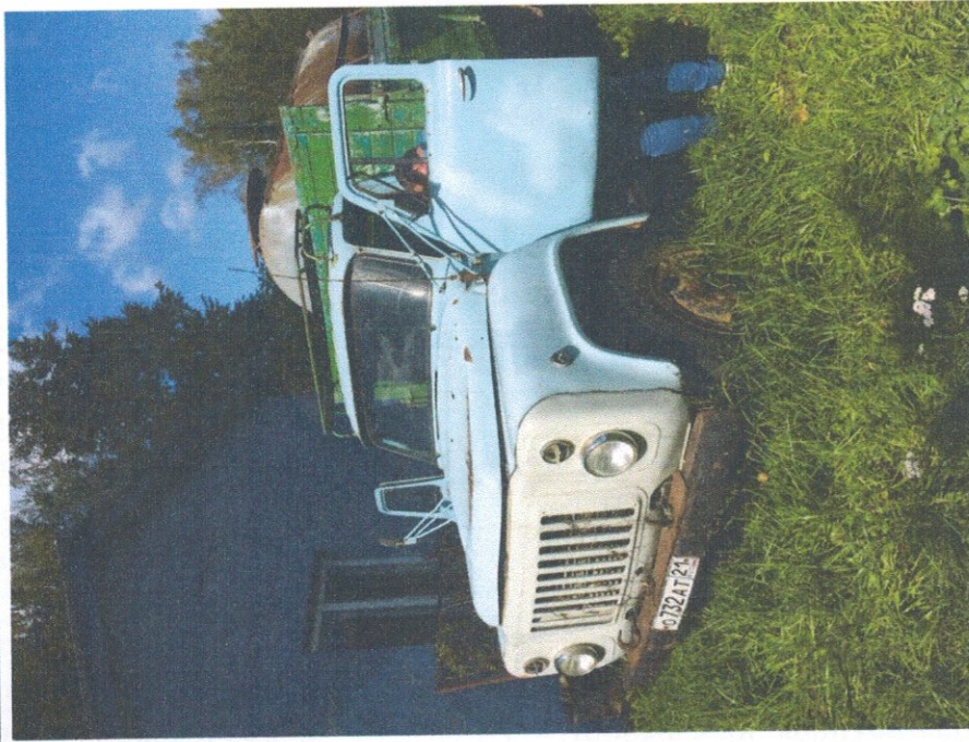
Фото 11: Общий вид