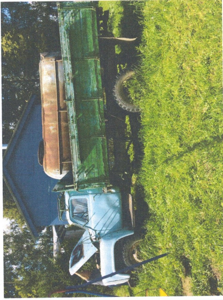
Фото 12: Общий вид