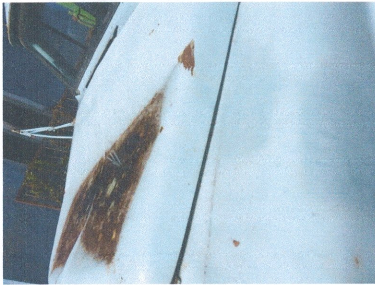
Фото 3: Общий вид