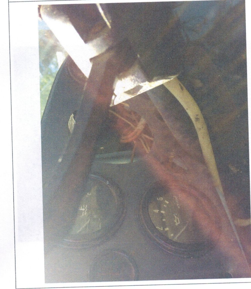
Фото 9: Приборная панель