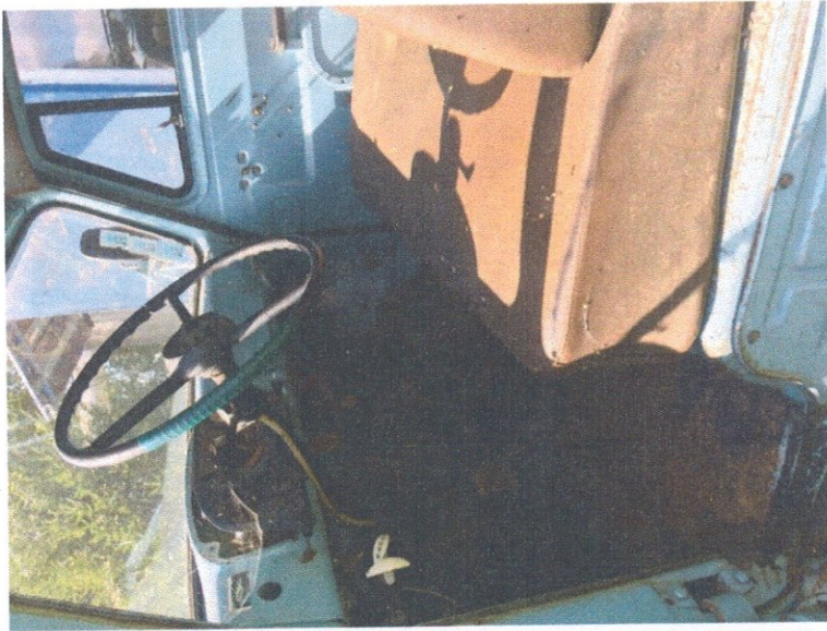
Фото 7: Состояние салона