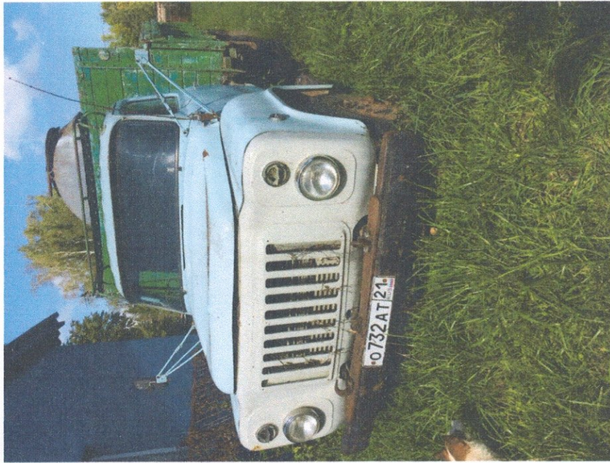
Фото 1: Общий вид