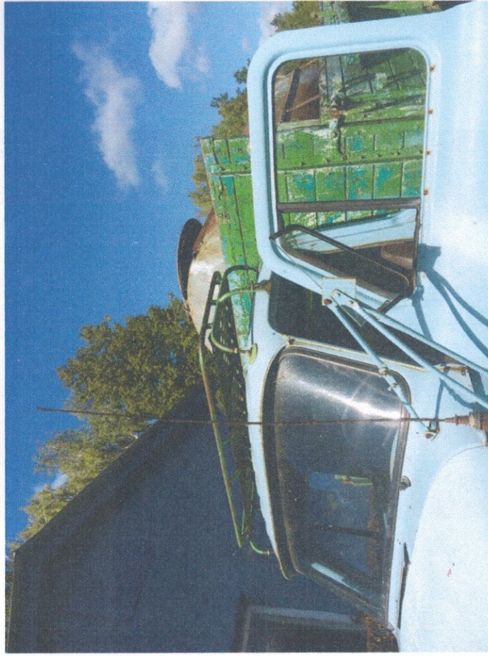
Фото 4: Общий вид