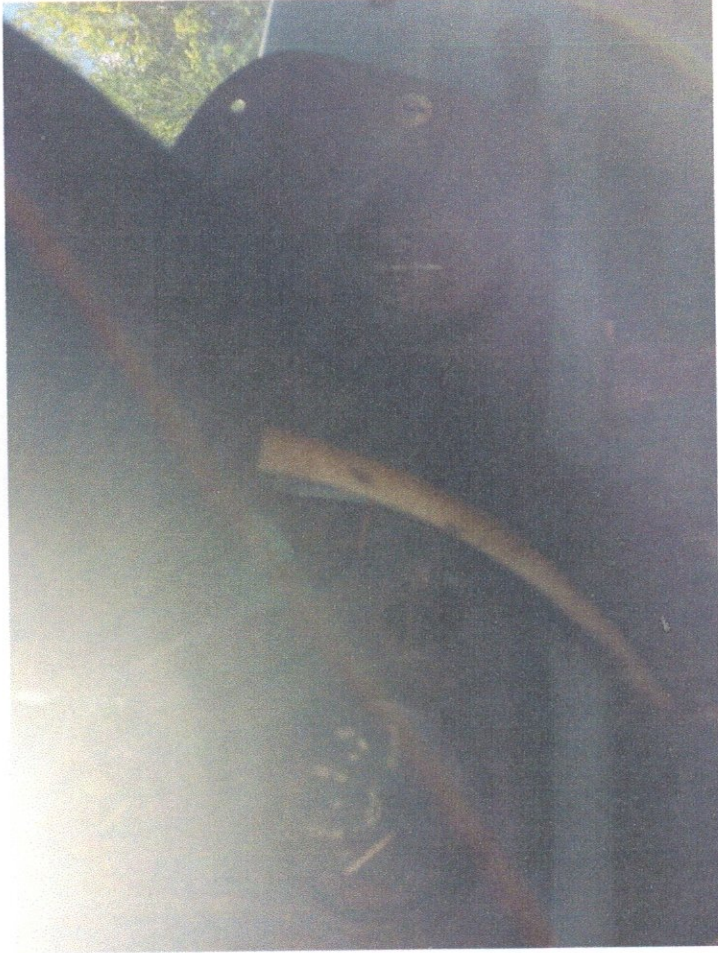
Фото 8: Приборная панель