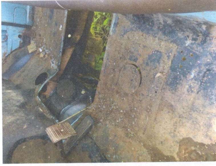
Фото 6: Сквозная коррозия кузова