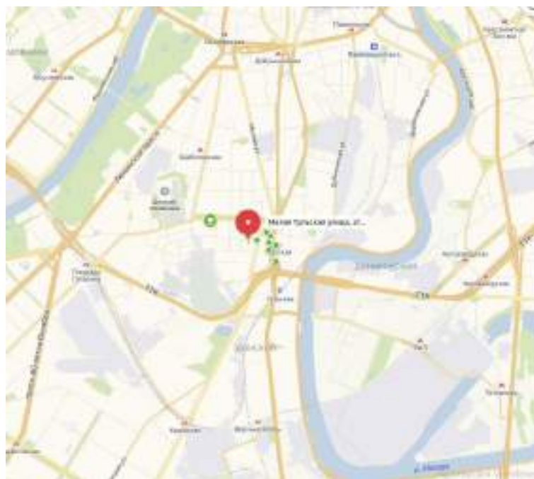
Рисунок 2. Карта локального расположения объекта оценки