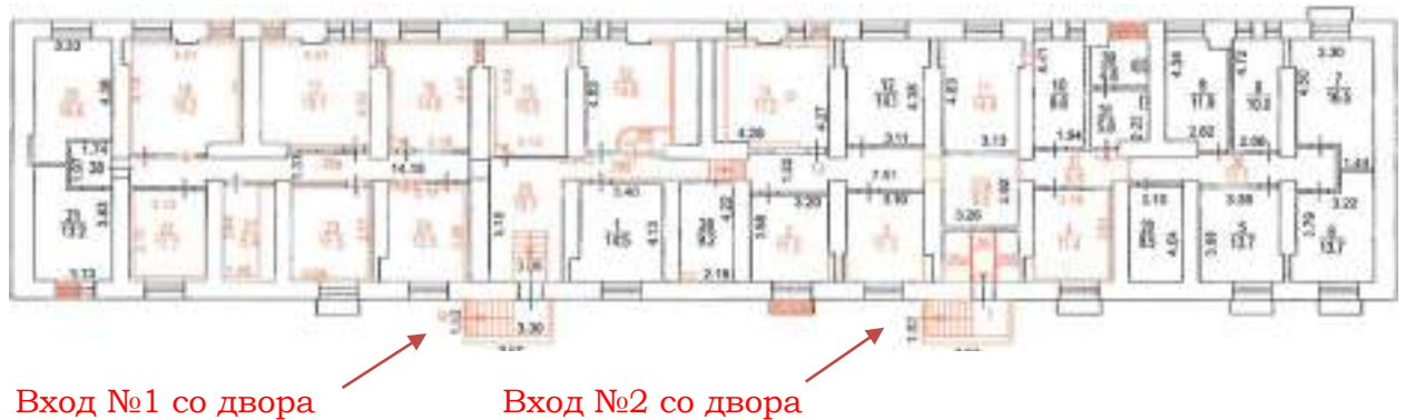
Рисунок 4. поэтажный план объекта оценки

На рис. 4 изображен поэтажный план оцениваемого помещения, где красными линиями обозначены не зарегистрированные в установленном порядке перепланировки.