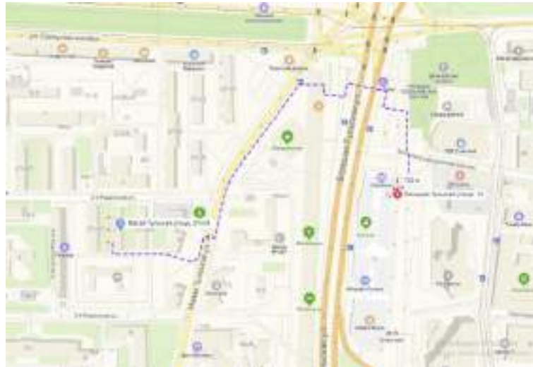
Рисунок 3. Расстояние до ближайшей станции метро