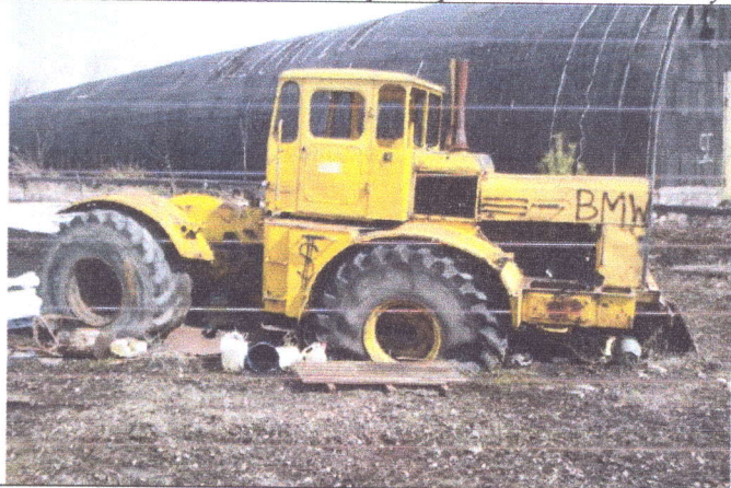
Трактор К-700А, 1986 года выпуска, регистрационный знак 21УУ6261