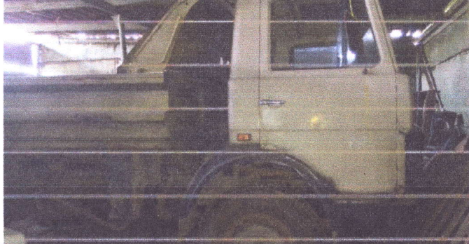
Грузовой самосвал МАЗ 555-1, 1993 года выпуска, регистрационный знак Т837АР21