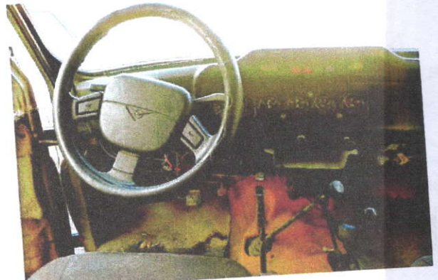
ООО "ЦНО "Меридиан"